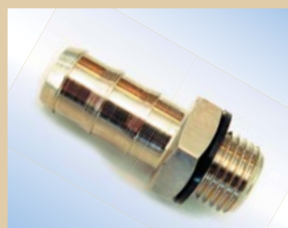
3/8" slangenippel til Standard Inflator Varenr.:..... 096057