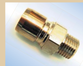
Hankobling til Standard/Flex Inflator og Quick Inflator (monteres på inflator for hurtigt skift mellem inflators) Varenr.:..... 096069