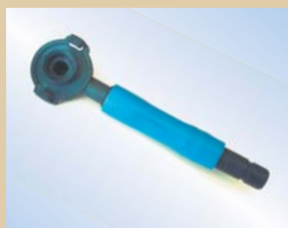
Slange og gribe kobling til Quick Inflator Varenr.:..... 096079