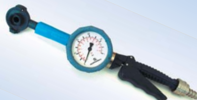
Bates Quick Inflator, med slange og manometer Ø 40 mm varenr. 096075