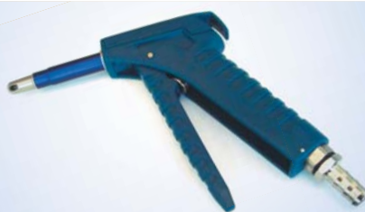
Bates Standard Inflator, varenr. 096072

Fyldespidser og andet tilbehør kan bestilles separat (se bagsiden)