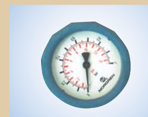
Manometer m/beskyttelseskappe (Ø63 mm - skala 0-1.0 bar) Varenr.:..... 096041