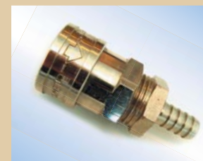
3/8" lynkobling uden ventil til Quick Inflator Varenr.:..... 096034