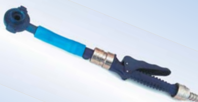
Bates Quick Inflator med slange, varenr. 096077