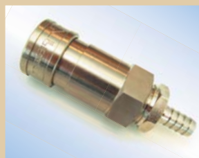
3/8" lynkobling med ventil til Quick Inflator Varenr.:..... 096030