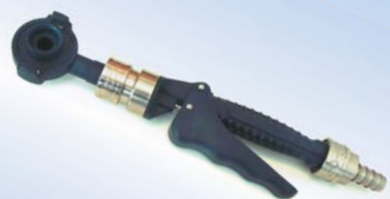
Bates Quick Inflator, varenr. 096078

Gribekobling og andet tilbehør kan bestilles separat (se bagsiden)