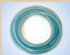
1/2" slange (50 m) Varenr.:..... 096035