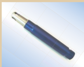
Fyldespids, Standard Inflator, blå, aluminium, 80 mm Varenr.:..... 096061