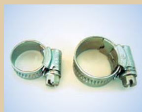
1/2" spændebånd Varenr.:..... 096036