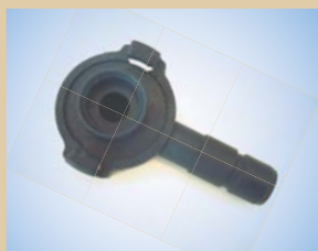
Gribe kobling til Quick Inflator Varenr.:..... 096054