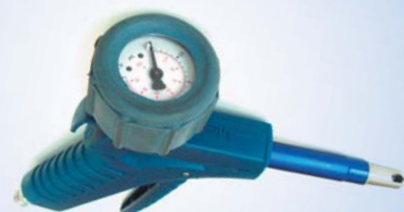
Bates Standard Inflator med Ø 40 mm manometer, varenr. 096073