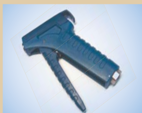
Håndtag til Inflator Varenr.:..... 096060