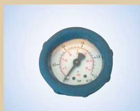
Manometer m/beskyttelseskappe (Ø40 mm - skala 0-2.5 bar) Varenr.:..... 096053