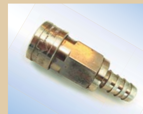
1/2" lynkobling med ventil til Quick Inflator Varenr.:..... 096051