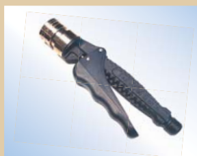
Håndtag til Quick Inflator Varenr.:..... 096074