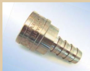
1/2" lynkobling uden ventil til Quick Inflator Varenr.:..... 096050